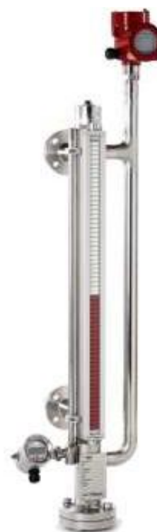
Рисунок 3 – Общий вид уровнемеров моделей BNA-SD (DUPlus), BNA-HD (DUPlus) (исполнение с магнитострикционным датчиком на первой байпасной камере и контактным микроволновым датчиком на второй байпасной камере)