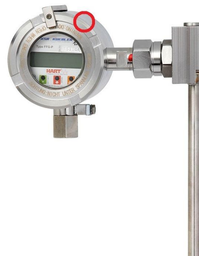
Рисунок 7 – Место нанесения на корпуса датчиков BLM пломбы поверителя