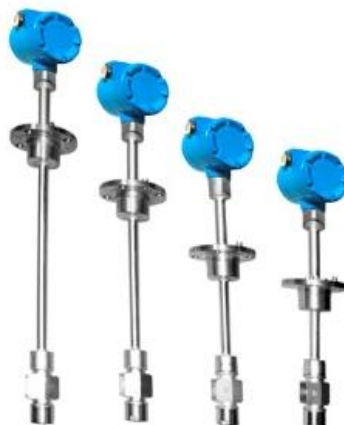
Рисунок 2 - Общий вид датчиков расхода ДРС модификации ДРС.3