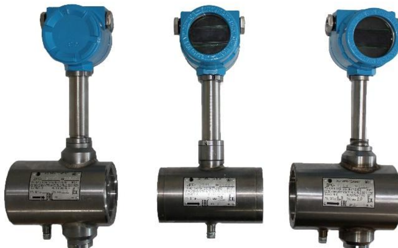
Рисунок 1 - Общий вид датчиков расхода ДРС модификации ДРС

Пломбировка от несанкционированного доступа датчиков расхода ДРС осуществляется нанесением знака поверки давлением на специальную мастику, установленную в чашечке винта крепления платы индикации или защитного экрана, расположенных под передней крышкой электронного преобразователя. Схема пломбировки от несанкционированного доступа, обозначение места нанесения знака поверки представлены на рисунке 4.