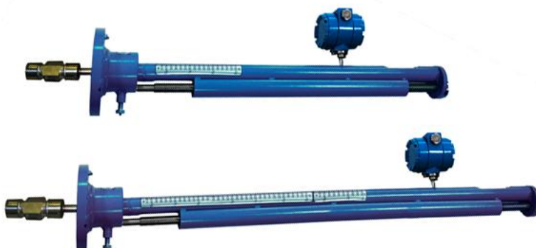
Рисунок 3 - Общий вид датчиков расхода ДРС модификации ДРС.3(Л)