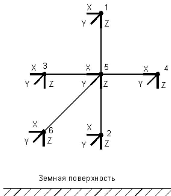
Рисунок 1 - Схема расположения трехкомпонентных феррозондовых датчиков в пространстве

Магнитометр может применяться в качестве индикатора магнитных аномалий при бесконтактном обследовании трубопроводов, в магниторазведочных, геофизических работах и предназначен для одновременного измерения и регистрации горизонтальных и вертикальных составляющих постоянного магнитного поля в шести точках пространства, как изображено на рисунке 1. Для этого в магнитометре предусмотрена жёсткая система направляющих цилиндрической формы длиной 420 мм, на концах которой закреплены трехкомпонентные феррозондовые датчики.