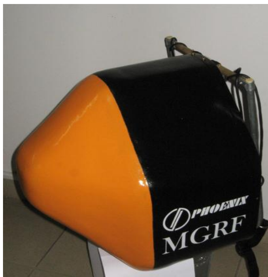
Рисунок 3 - Общий вид магнитометра (в коже)