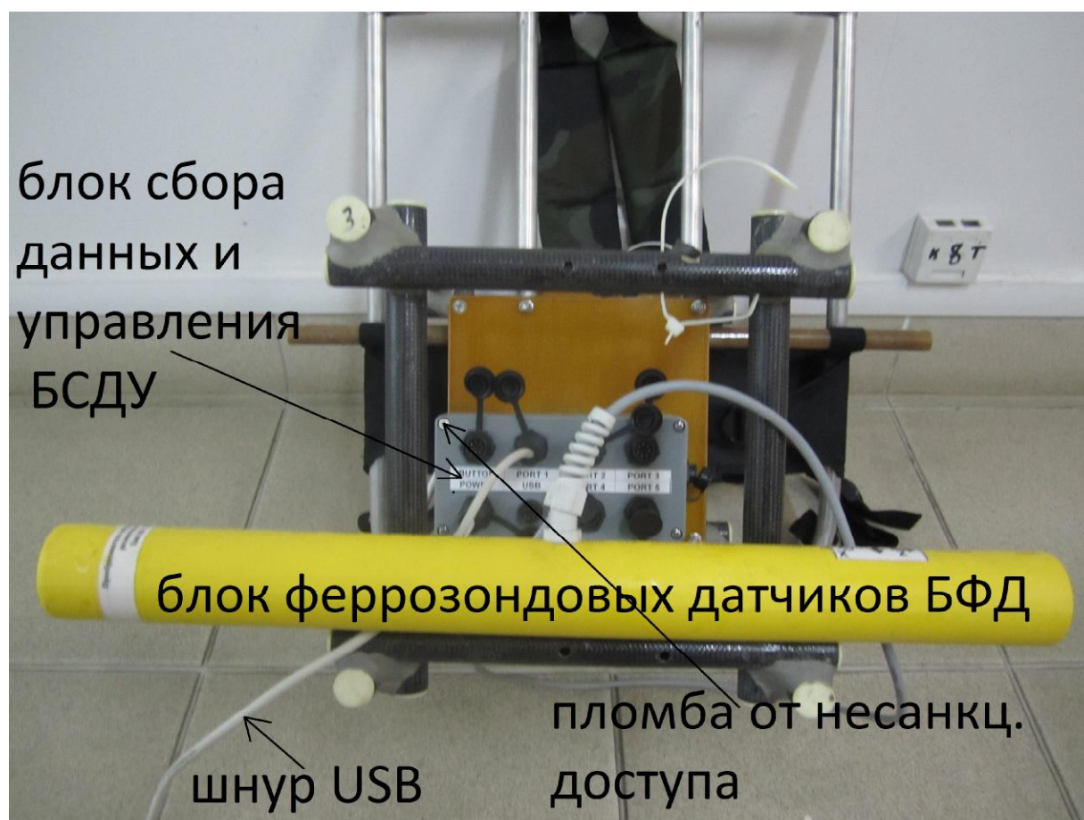
Рисунок 2 - Общий вид блока феррозондовых датчиков магнитометра с блоком управления и шнуром для подключения компьютера без защитного кожуха

На крышке кожуха и возле задней крышки блока по одному из винтов закрыты пломбами для защиты аппаратуры от несанкционированного доступа.