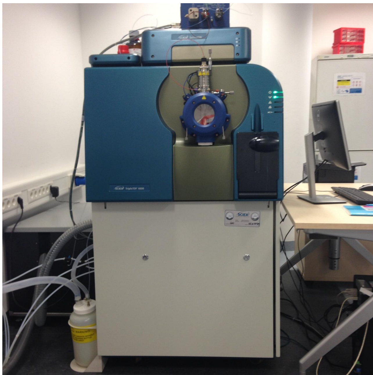
Рисунок 2 - Общий вид масс-спектрометра 6600 TripleTOF с системой дифференциальной ионной подвижности SelexIon сверху