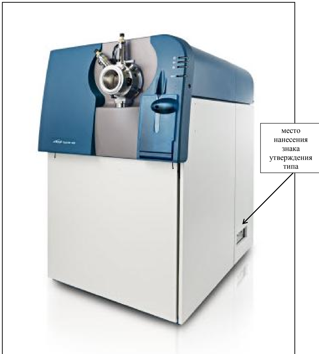
Рисунок 1 - Общий вид масс-спектрометра 6600 TripleTOF и обозначение места нанесения знака утверждения типа