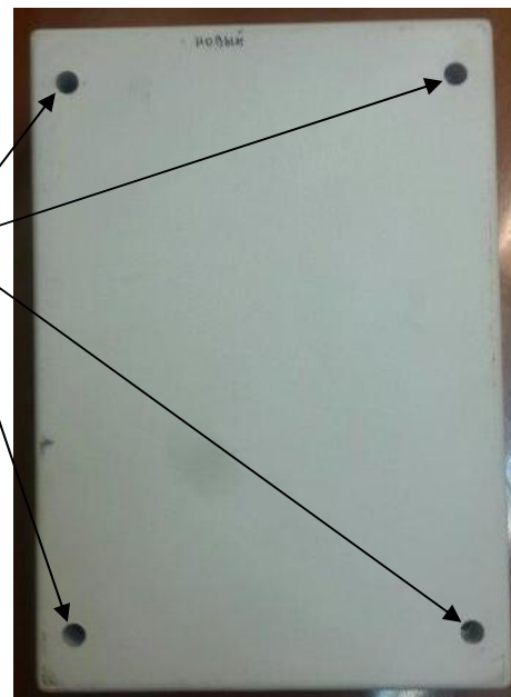
Рисунок 3 - Схема пломбировки от несанкционированного доступа, обозначение места нанесения знака поверки

Место нанесения знака поверки в виде наклейки