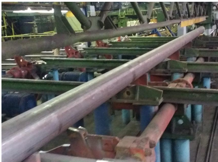
Рисунок 1 - Общий вид системы