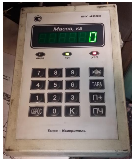
Рисунок 2 - Общий вид терминала