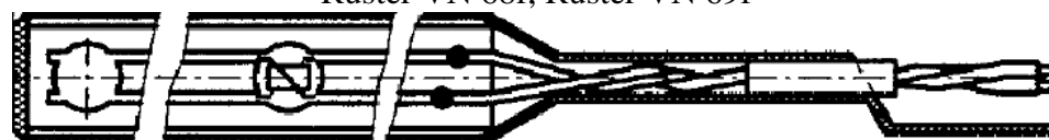
Рисунок 9 - Термопреобразователи модификаций Ruster Ruster VN 80f, Ruster VN 81f, Ruster VN 82f, Ruster VN 83f, Ruster VN 84f, Ruster VN 85f, Ruster VN 86f, Ruster VN 87f, Ruster VN 88f, Ruster VN 89f