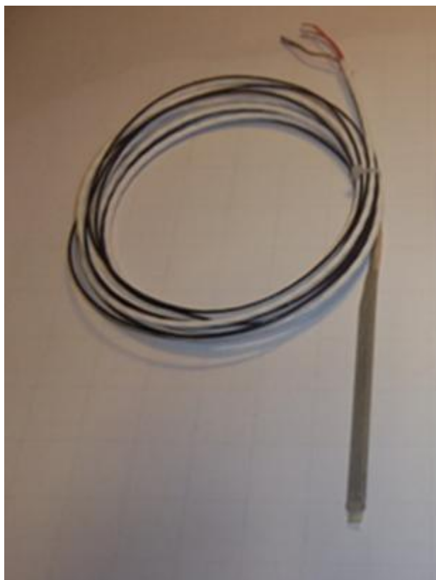
Рисунок 2 – Общий вид термопреобразователей сопротивления платиновых серии ExNWT