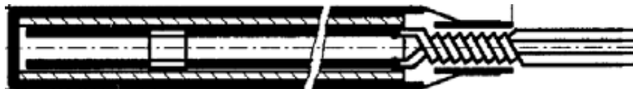
Рисунок 5 - Термопреобразователи модификаций Ruster VN 20f, Ruster VN 21f, Ruster VN 22f, Ruster VN 23f, Ruster VN 24f, Ruster VN 25f, Ruster VN 26f, Ruster VN 27f, Ruster VN 28f, Ruster VN 29f