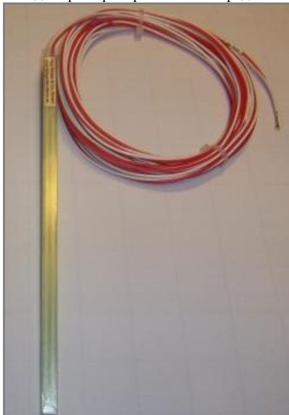
Рисунок 1 – Общий вид термопреобразователей сопротивления платиновых серии ExNWT

Фотографии общего вида термопреобразователей представлены на рисунках 1-3.