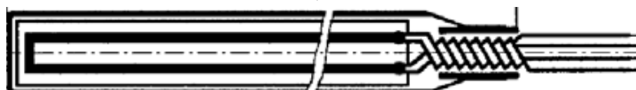
Рисунок 6 - Термопреобразователи модификаций Ruster VN 30f, Ruster VN 31f, Ruster VN 32f, Ruster VN 33f, Ruster VN 34f, Ruster VN 35f, Ruster VN 36f, Ruster VN 37f, Ruster VN 38f, Ruster VN 39f