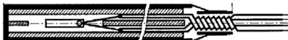
Рисунок 8 - Термопреобразователи модификаций Ruster VN 60f, Ruster VN 61f, Ruster VN 62f, Ruster VN 63f, Ruster VN 64f, Ruster VN 65f, Ruster VN 66f, Ruster VN 67f, Ruster VN 68f, Ruster VN 69f