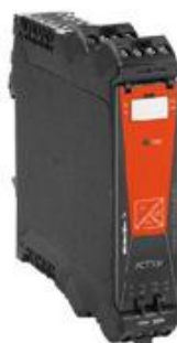
б) преобразователи АСТ20Р