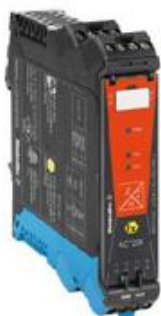
а) преобразователи АСТ20Х