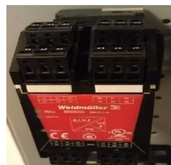
е) преобразователи WAZ