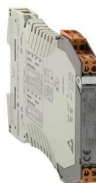
и) преобразователи WTS