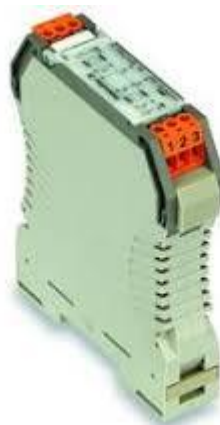
и) преобразователи WTZ