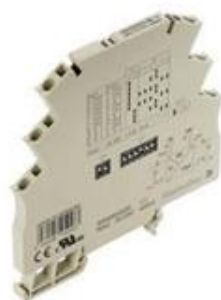
д) преобразователи MAZ