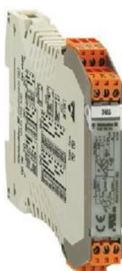
ж) преобразователи WAS