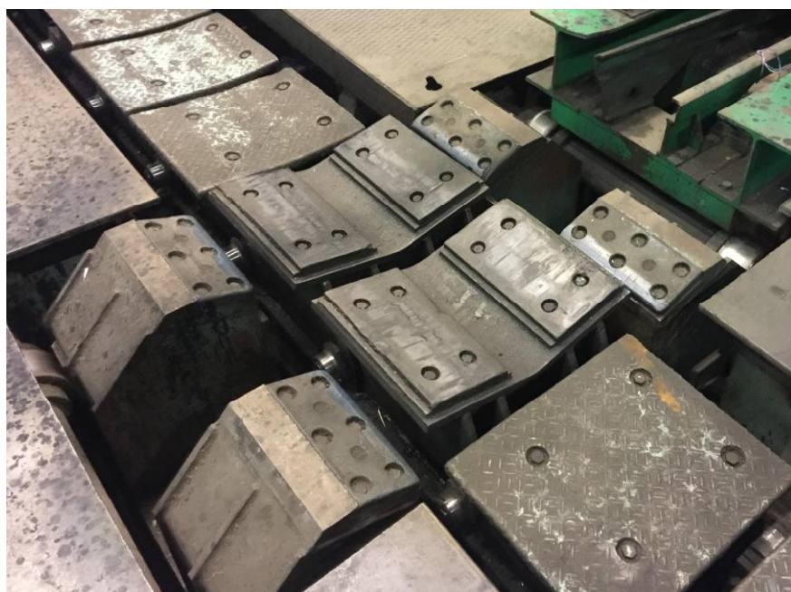
Рисунок 1 - Общий вид весов

Общий вид весов представлен на рисунке 1, общий вид модуля SIWAREX FTA - на рисунке 2, общий вид терминала - на рисунке 3.