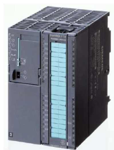
Рисунок 2 - Общий вид модуля SIWAREX FTA