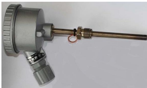
б) преобразователь температуры