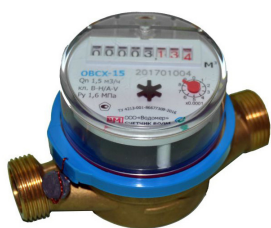
а) Счётчик воды крыльчатый ОВСХ-15