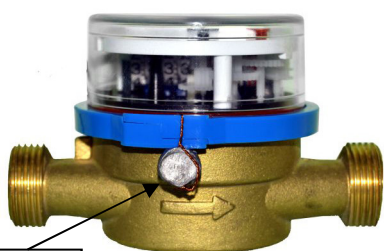
Схема пломбировки счётчиков холодной и горячей воды крыльчатых ОВСХ, ОВСХд, ОВСГ, ОВСГд, ОВСТ приведена на рисунке 2.