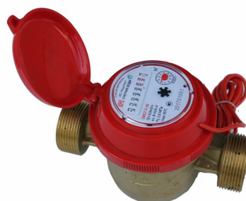
г) Счётчик воды крыльчатый ОВСГд-32