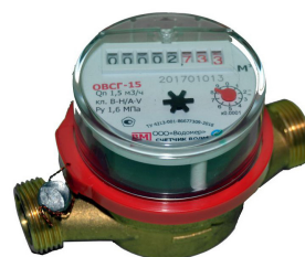
б) Счётчик воды крыльчатый ОВСГ-15