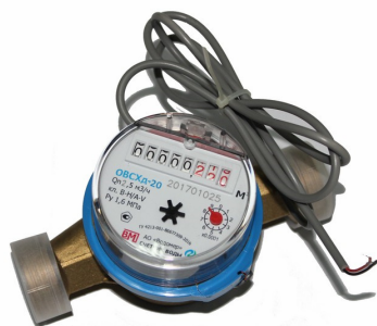
в) Счётчик воды крыльчатый ОВСХд-20