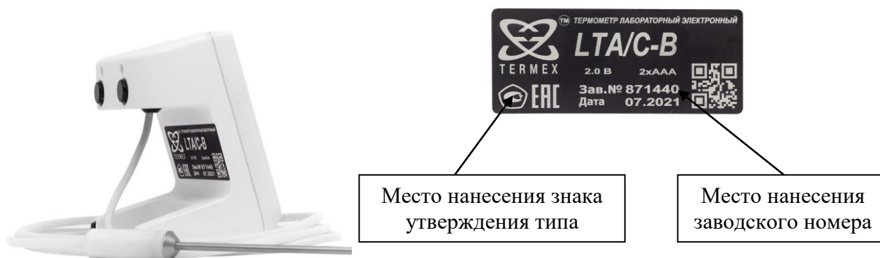
Рисунок 2 – Внешний вид термометра с неразъемным соединением датчика к электронному блоку и его пломбировочная наклейка с указанием мест нанесения знака утверждения типа и заводского номера