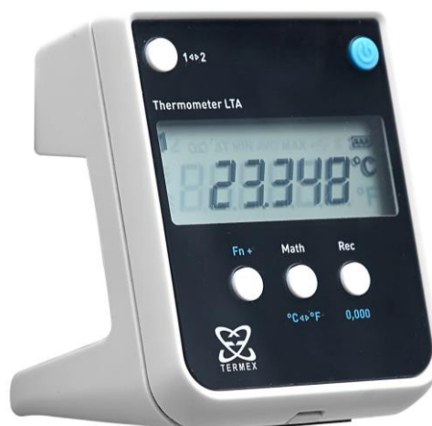
Рисунок 3 – Внешний вид электронного блока термометра, имеющего второй канал измерений температуры или встроенный секундомер

Пломбирование термометров осуществляется путем наклеивания на заднюю сторону электронного блока пломбировочной наклейки с маркировкой.