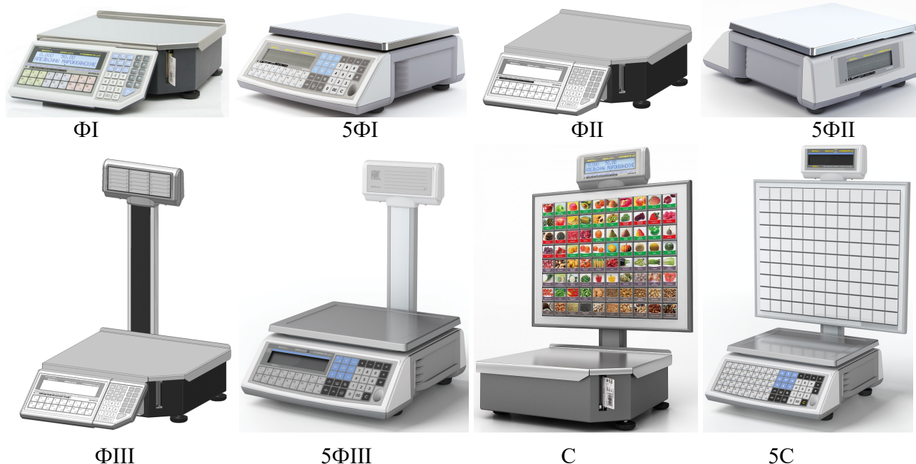
Рисунок 1а – Общий вид весов (индексы: FI; 5FI; FI; 5FI; FI; 5FI; C; 5C)