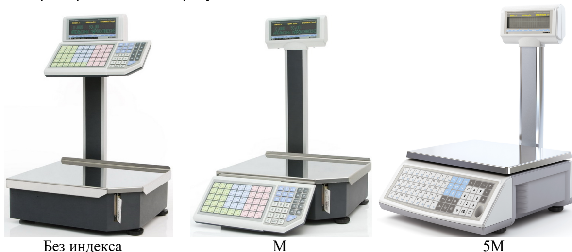
Рисунок 1 – Общий вид весов (индексы: М; 5М; и без индекса)

Схемы пломбировки от несанкционированного доступа, обозначение места нанесения знака поверки представлены на рисунке 2.