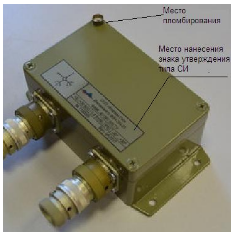
Рисунок 2 - Схема пломбировки от несанкционированного доступа и обозначение места нанесения знака утверждения типа СИ