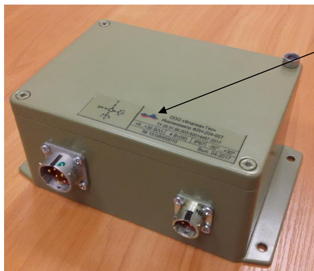
Схема пломбировки от несанкционированного доступа и обозначение места нанесения знака утверждения типа СИ представлены на рисунке 2.

Для защиты от несанкционированного доступа выполнено опломбирование головки одного из винтов крепления крышки инклинометра.