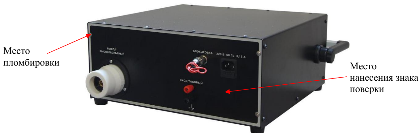
Рисунок 2 - Место пломбировки от несанкционированного доступа и нанесения знака поверки