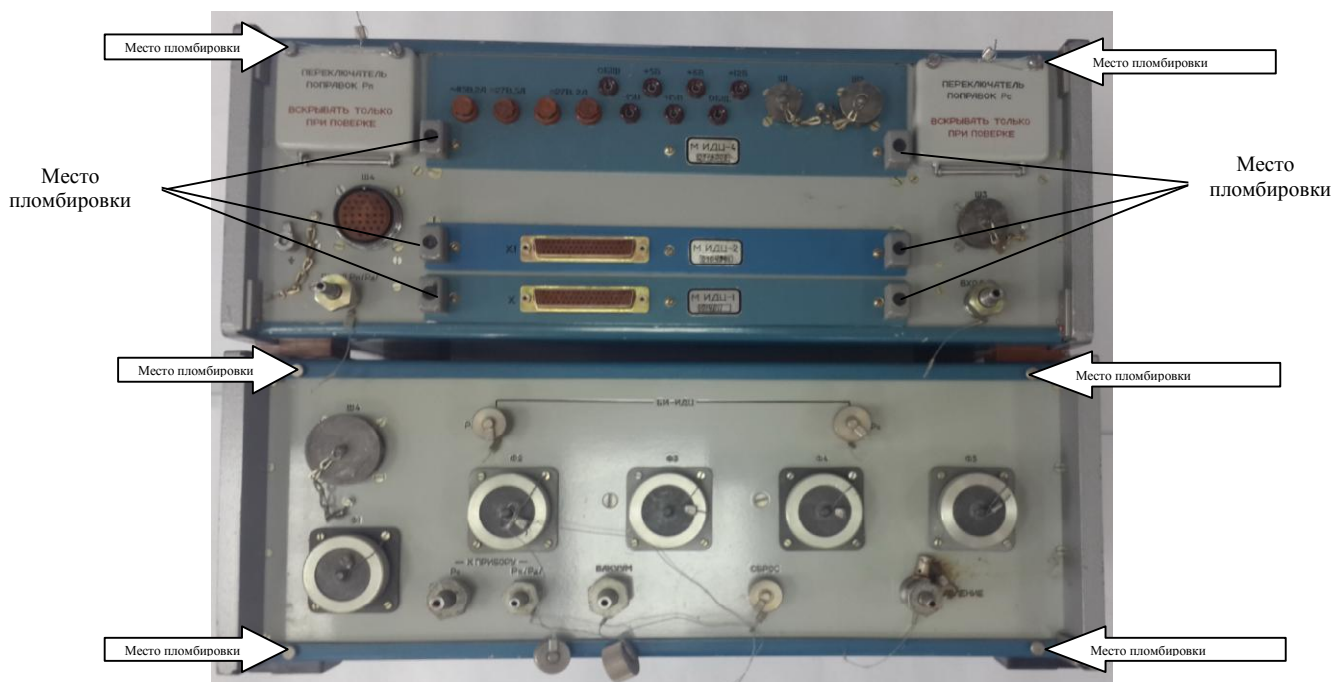
Рисунок 2 – Схема пломбировки от несанкционированного доступа, обозначение мест нанесения знака поверки