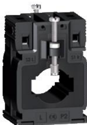
б) модификации METSECT5MAXXX