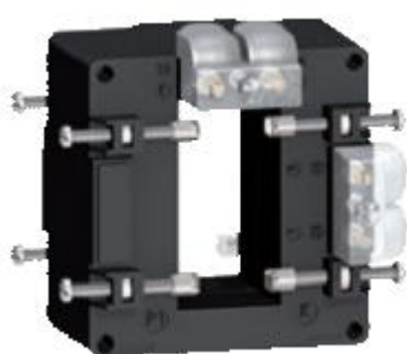
к) модификации METSECT5DAXXX