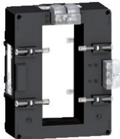
м) модификации METSECT5DCXXX