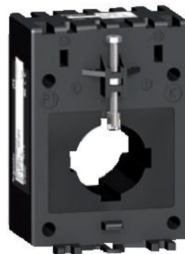
е) модификации METSECT5MEXXX