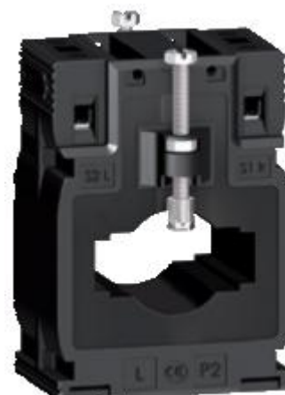
в) модификации METSECT5MBXXX