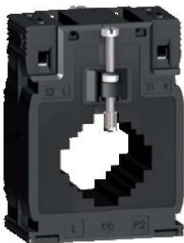
д) модификации METSECT5MCXXX