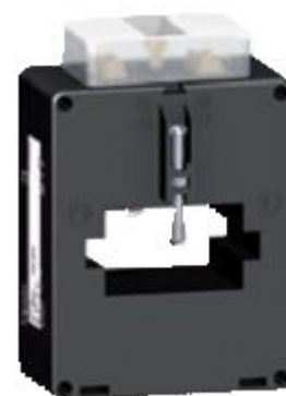
и) модификации METSECT5VFXXX