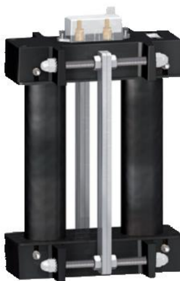
з) модификации METSECT5VVXXX