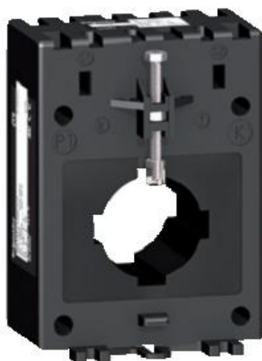
ж) модификации METSECT5MFXXX