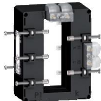
п) модификации METSECT5DHXXX