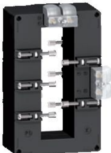
л) модификации METSECT5DBXXX