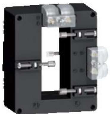
н) модификации METSECT5DDXXX