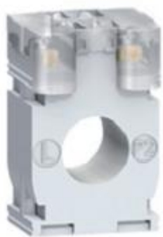
а) модификации METSECT5CCXXX

Общий вид трансформаторов различных модификаций представлен на рисунке 1. Пломбирование трансформаторов не предусмотрено.