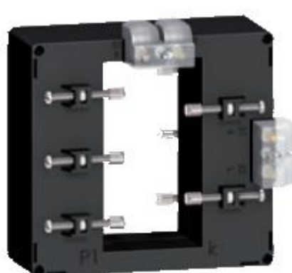
о) модификации METSECT5DEXXX