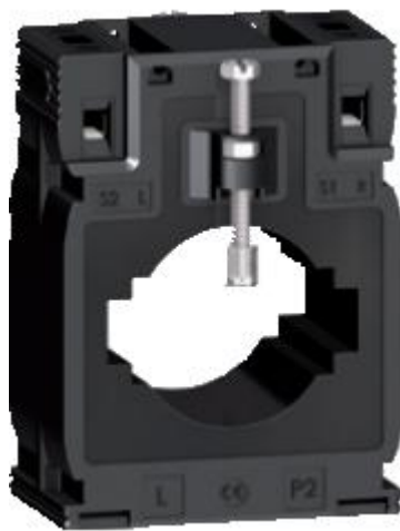
г) модификации METSECT5MDXXX