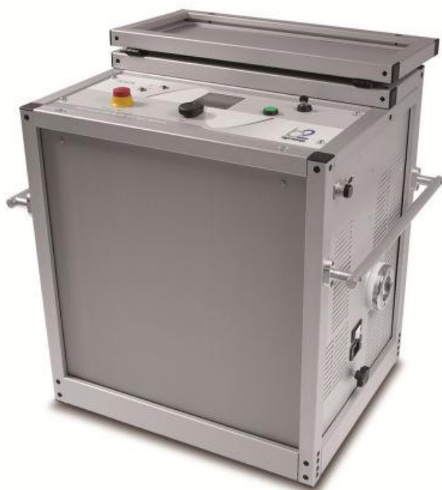
Рисунок 5 - Общий вид установок HVA54/80, HVA90, HVA94