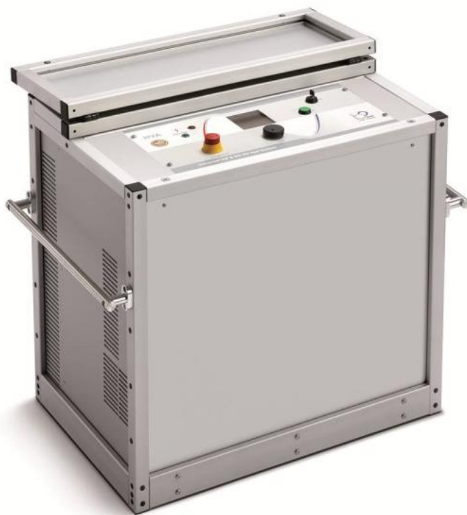
Рисунок 6 - Общий вид установок HVA120