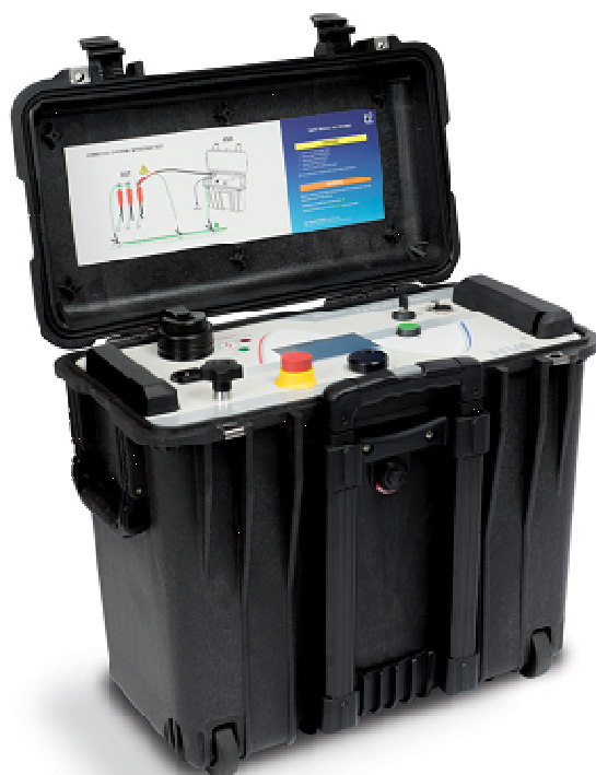
Рисунок 4 - Общий вид установок HVA34-1, HVA45