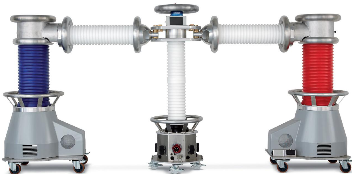
Рисунок 7 - Общий вид установок NVA200