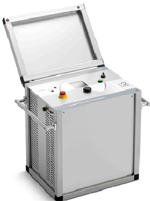
Рисунок 3 - Общий вид установок HVA30-5, HVA30-7, HVA40-5, HVA54-3, HVA60, HVA65, HVA68-2,