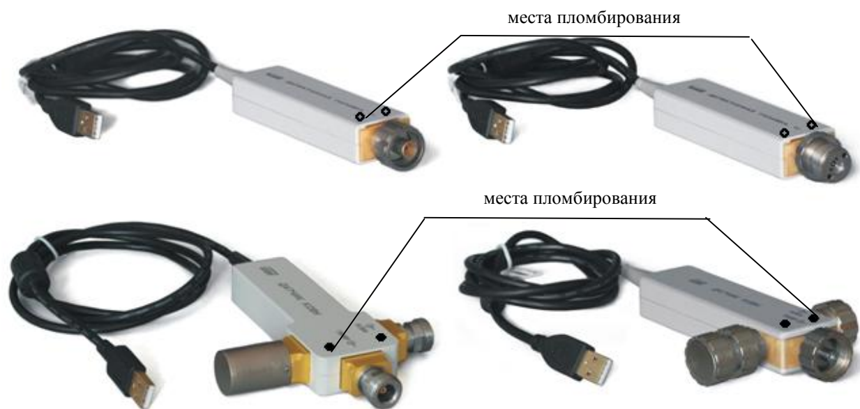
Рисунок 3 - Общий вид внешних узлов из комплекта измерителей модулей коэффициентов передачи и отражения P2-145, P2-145/1