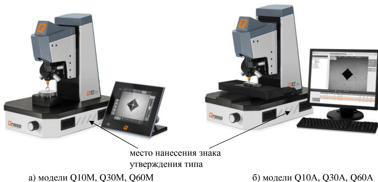
Рисунок 1 - Внешний вид твердомеров

Внешний вид твердомеров с указанием мест нанесения знака утверждения типа и пломбирования приведён на рисунках 1, 2, 3.