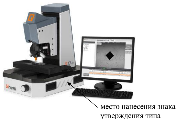
в) модели Q10A+, Q30A+, Q60A+ Рисунок 2 - Внешний вид твердомеров