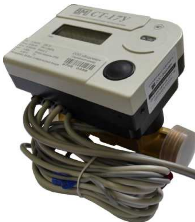
Рисунок 1 - Общий вид теплосчётчиков