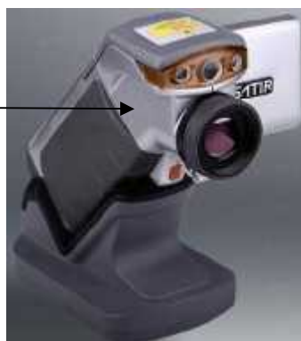
Рисунок 2 - Общий вид тепловизоров портативных переносных SAT моделей HotFind E8N, HotFind E8TN, HotFind E8GN