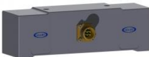
Рисунок 1 - Общий вид датчиков силоизмерительных тензорезисторных АТВ-GK100/10K/AINK, АТВ-GK100/75K/AINK

Общий вид датчиков представлен на рисунке 1.