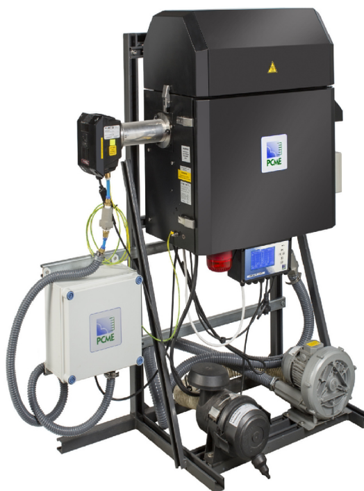
Рисунок 3 - Общий вид анализаторов пыли РСМЕ модели QAL 181 исполнения WS