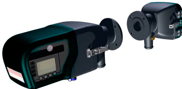
Рисунок 1 - Общий вид анализаторов пыли РСМЕ модели STACK 710

после проведения градуировки на месте эксплуатации (например, в соответствии с ГОСТ Р ИСО 9096-2006 «Выбросы стационарных источников. Определение массовой концентрации твёрдых частиц ручным гравиметрическим методом») и выводятся на экран контроллера или на экран анализатора (модель STACK 710). Общий вид анализаторов изображён на рисунках 1 - 3. Пломбировка корпуса не предусмотрена.