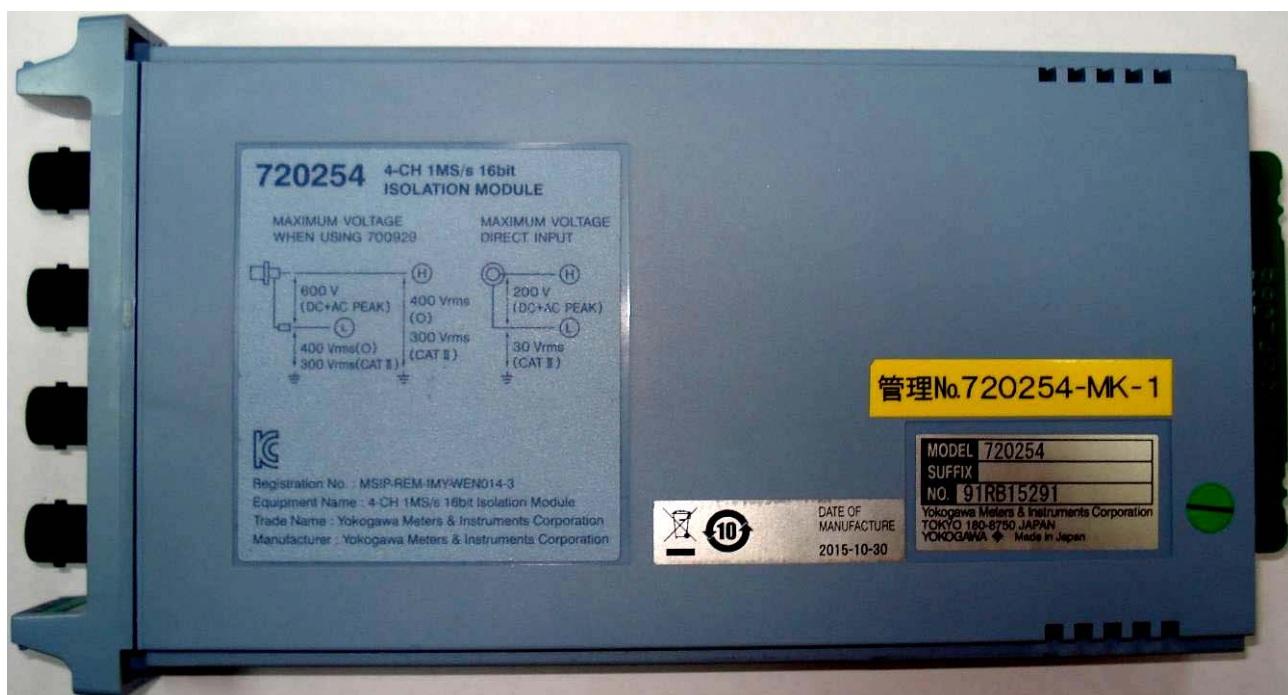
Рисунок 9 - Общий вид модулей сменных 720254