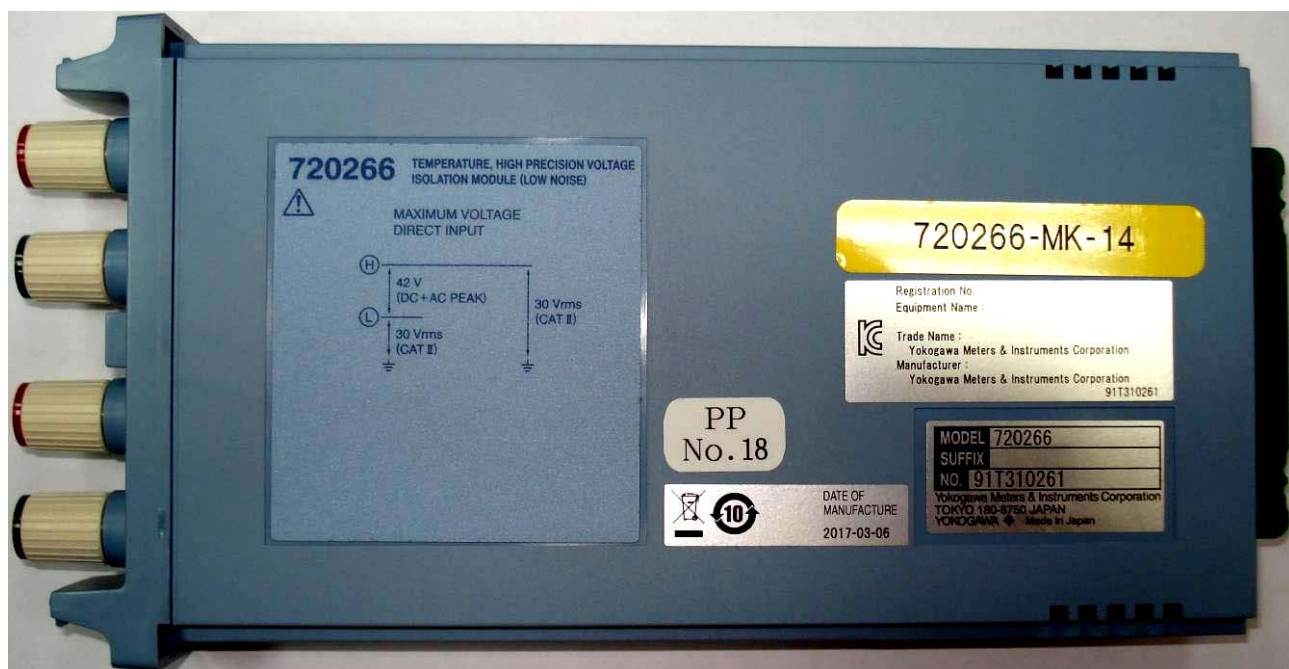
Рисунок 10 - Общий вид модулей сменных 720266