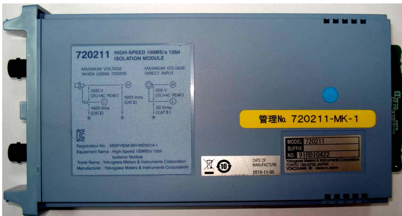
Рисунок 6 - Общий вид модулей сменных 720211