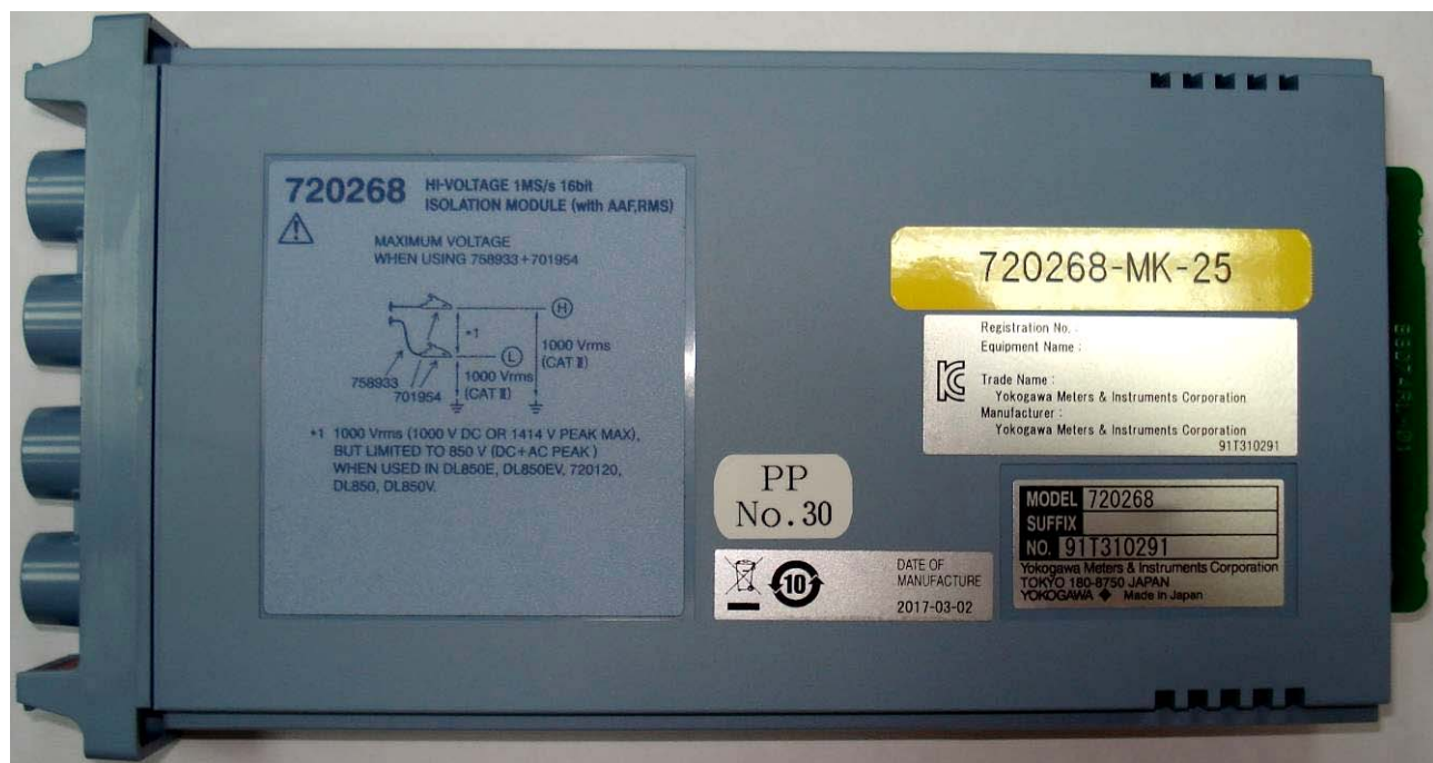
Рисунок 11 - Общий вид модулей сменных 720268