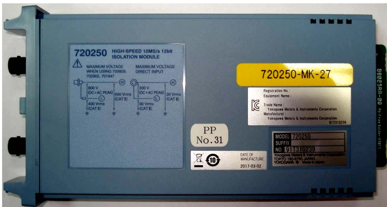
Рисунок 8 - Общий вид модулей сменных 720250