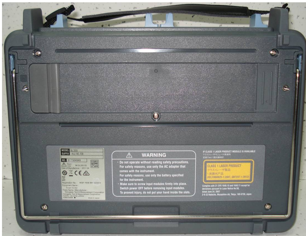
Рисунок 2 - Общий вид базового блока осциллографов-регистраторов DL350. Вид сзади