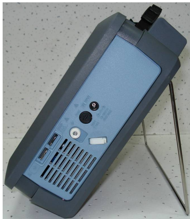
Рисунок 5 - Общий вид базового блока осциллографов-регистраторов DL350. Вид справа