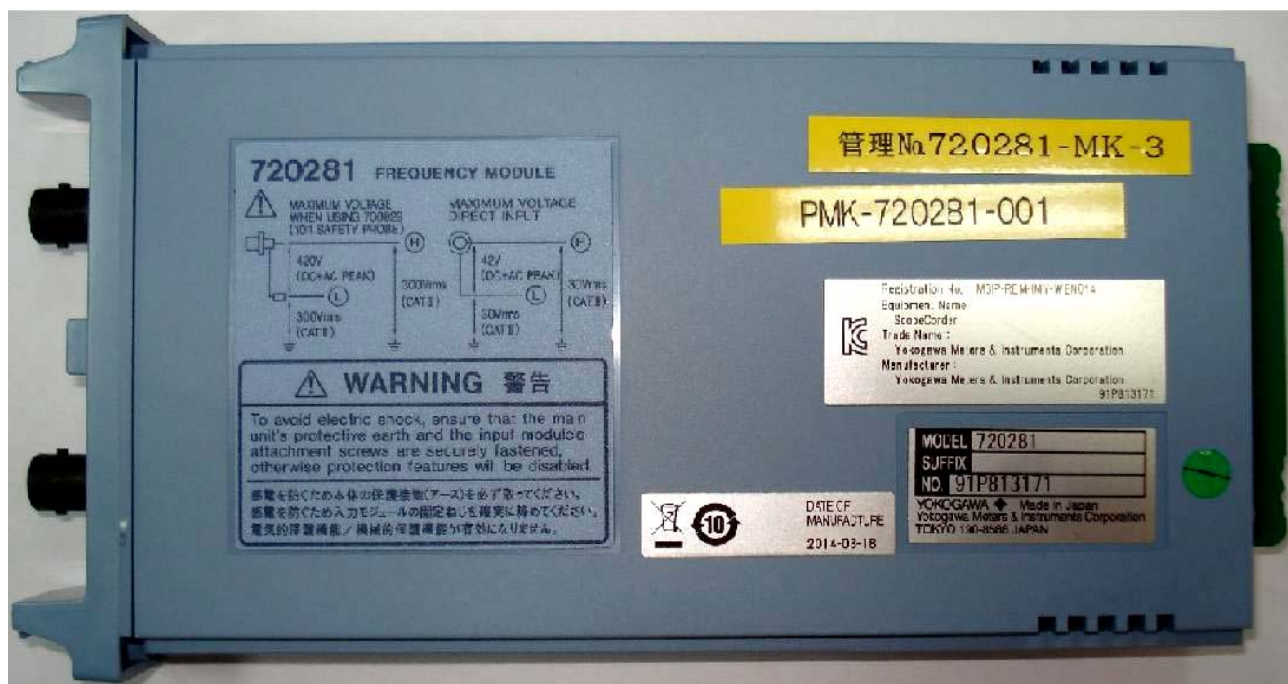
Рисунок 12 - Общий вид модулей сменных 720281