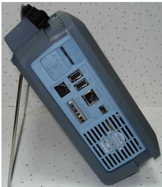
Рисунок 4 - Общий вид базового блока осциллографов-регистраторов DL350. Вид слева