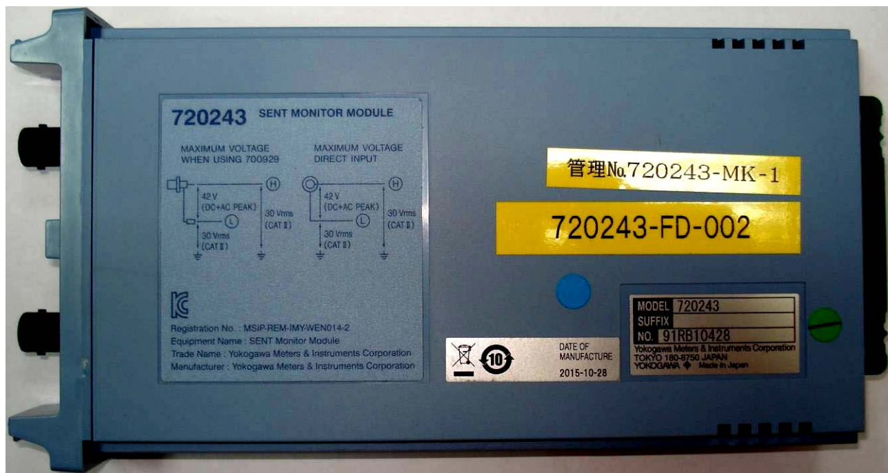
Рисунок 7 - Общий вид модулей сменных 720243