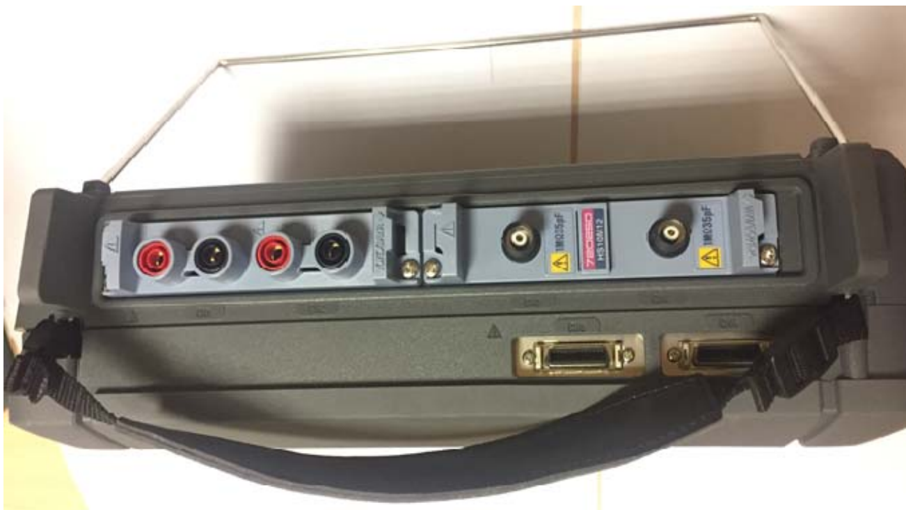
Рисунок 3 - Общий вид базового блока осциллографов-регистраторов DL350. Вид сверху