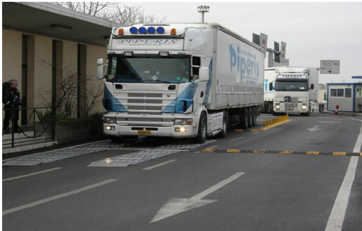
Рисунок 2 - Общий вид систем взвешивания автомобильных транспортных средств RANGE CAPTELS CET (компактная модификация)