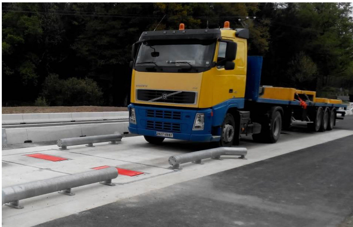
Рисунок 1 - Общий вид систем взвешивания автомобильных транспортных средств RANGE CAPTELS CET (стационарная модификация)