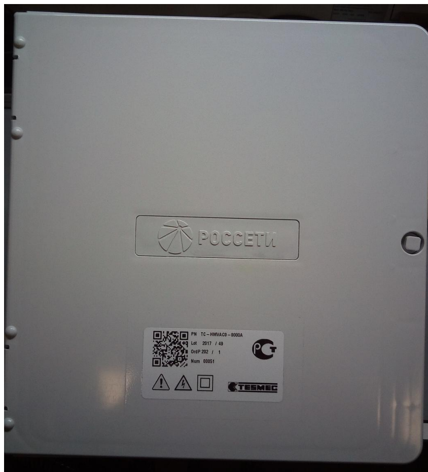
Рисунок 1 - Общий вид корпуса (IP54) счетчика