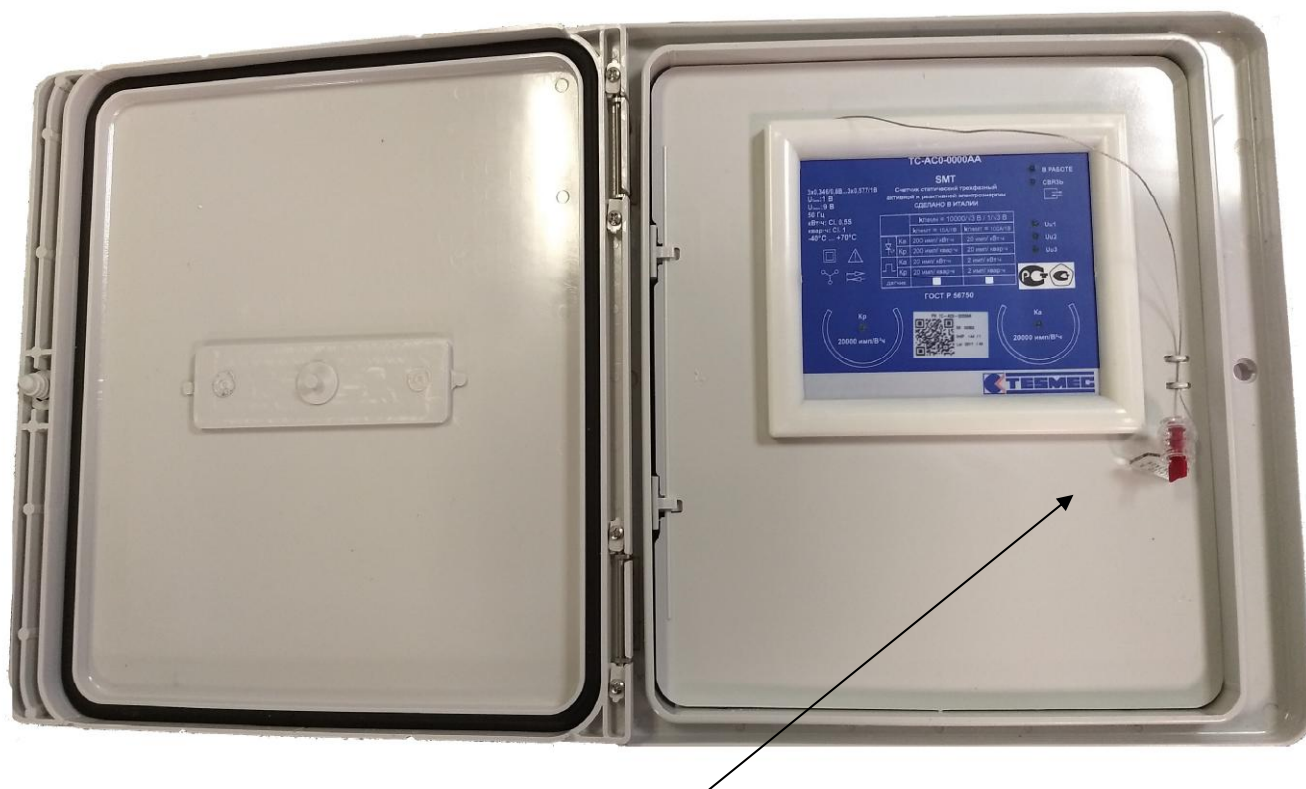
Рисунок 2 - Общий вид счетчика с указанием места пломбирования электроснабжающей организацией