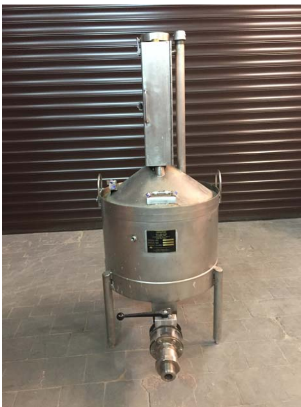
Рисунок 1 - Общий вид мерника металлического эталонного 1-го разряда SERAPHIN SERIES «J»

Общий вид мерника металлического эталонного 1-го разряда SERAPHIN SERIES «J» представлен на рисунке 1.