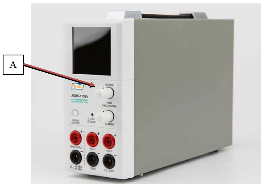
Рисунок 1 - Внешний вид источников питания АКІП-1101А, АКІП-1102А, АКІП-1103А и место нанесения знака утверждения типа (А)