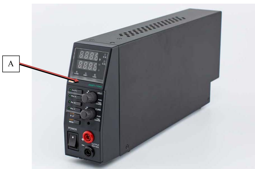
Рисунок 2 - Внешний вид источников питания АКІП-1104А, АКІП-1105А и место нанесения знака утверждения типа (А)