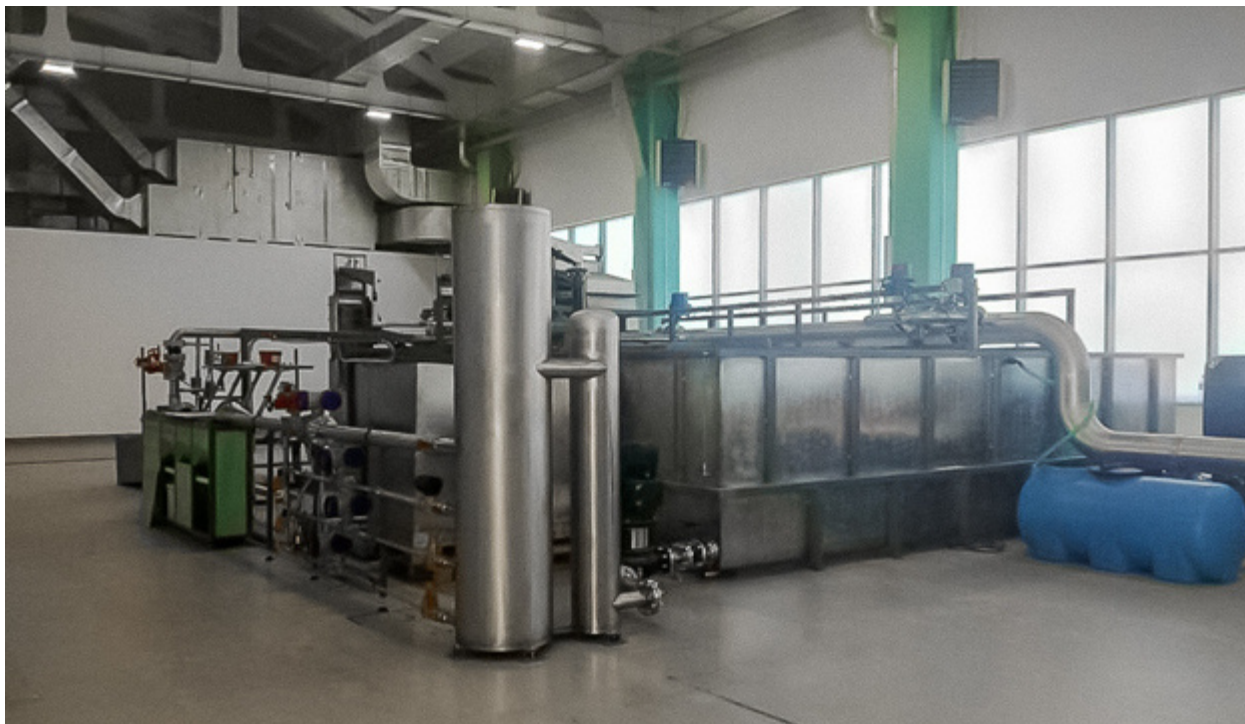
Рисунок 1 – Общий вид установок поверочных Эрмитаж

Пломбировка установок поверочных Эрмитаж осуществляется с помощью свинцовой (пластмассовой) пломбы и проволоки, которой пломбируется фланцевые соединения расходомеров установки, с нанесением знака поверки на пломбу. Средства измерений условий окружающей и измеряемой сред пломбируются в соответствии с описанием типа на конкретное средство измерений. Места пломбирования фланцевых соединений расходомеров установок поверочных Эрмитаж приведены на рисунке 2.