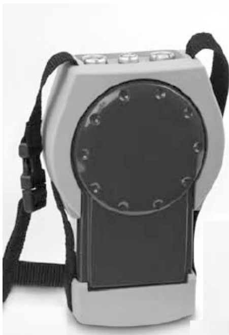
Рисунок 1 - Внешний вид устройства OPTICHECK