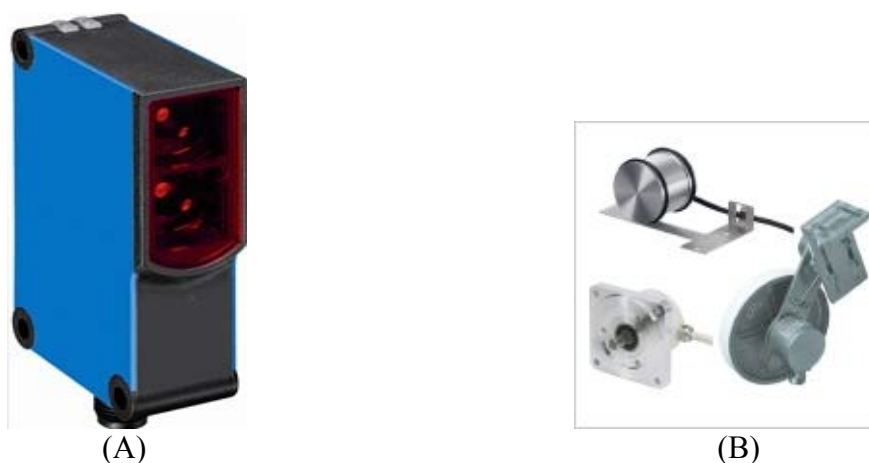
Рисунок 2 - Триггер (поз. A) и энкодер (поз. B) комплексов для измерений габаритных размеров APACHE conveyor conv8

Пломбирование комплексов не предусмотрено.