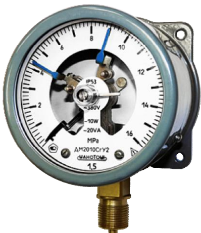
Рисунок 4 - Фотографии общего вида манометров, вакуумметров и мановакуумметров показывающих сигнализирующих ДМ2010Сг, ДВ2010Сг,