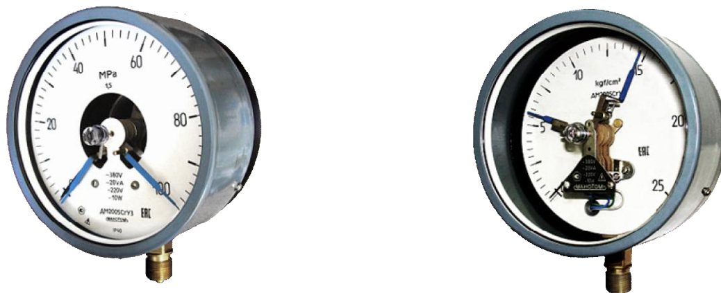
Рисунок 1 - Фотографии общего вида манометров, вакуумметров и мановакуумметров показывающих сигнализирующих ДМ2005Сг, ДВ2005Сг, ДА2005Сг

Место нанесения знака поверки и пломбирования приборов приведено на рисунке 6.