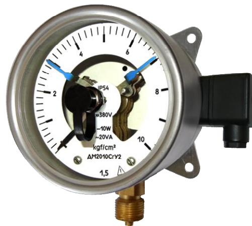
Рисунок 5 - Фотографии общего вида манометров, вакуумметров и мановакуумметров показывающих сигнализирующих с боковым кабельным