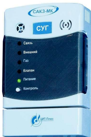
Рисунок 1 - Общий вид сигнализаторов исполнения СЗ-3Е, СЗ-3ЕВ, СЗ-3ЕР

Общий вид сигнализатора загазованности сжиженным газом типа СЗ-3 и место опломбирования представлены на рисунках 1-6.