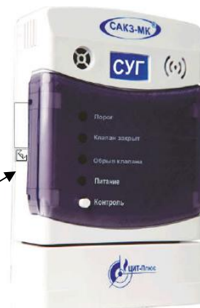
Рисунок 6 - Место установки пломбы сигнализатора исполнения СЗ-3-1ГТ