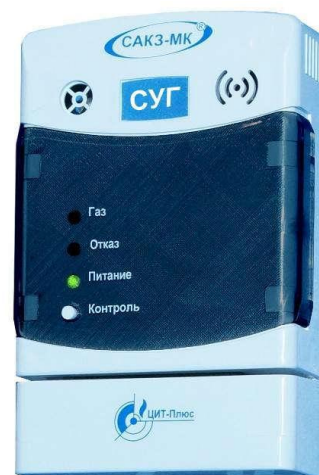
Рисунок 4 - Общий вид сигнализаторов исполнения СЗ-3-1АГ, СЗ-3-1АВ