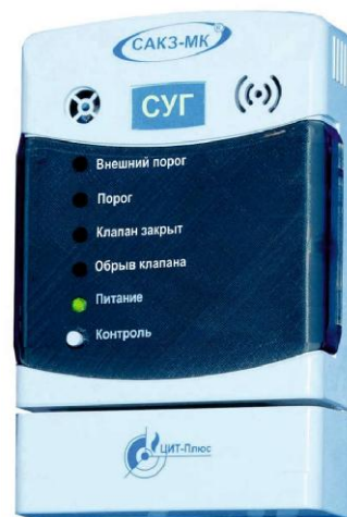
Рисунок 2 - Общий вид сигнализаторов исполнения СЗ-3-1Г, СЗ-3-2Г