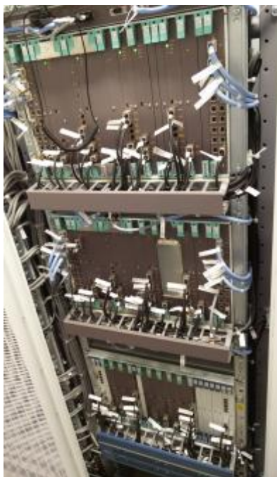
Рисунок 1 - Общий вид оборудования с открытой дверью

Внешний вид оборудования и место блокировки от несанкционированного доступа, представлены на рисунках 1 и 2.