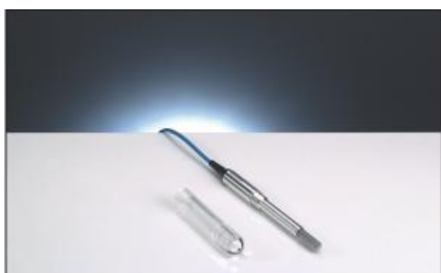
1.15 Ионизационная камера PTW-30012