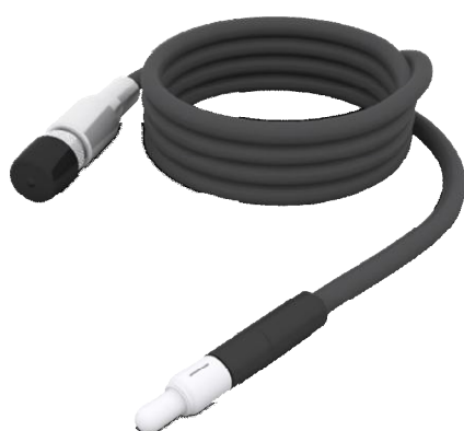
1.17 Ионизационная камера Sun Nuclear SNC125c