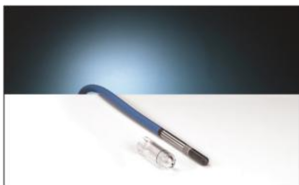
1.5 Ионизационная камера PTW-31013