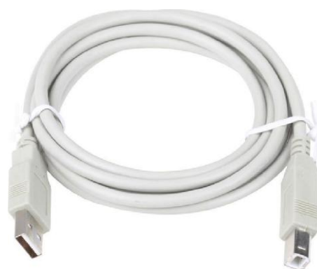
1.2 Сетевой/интерфейсный кабель