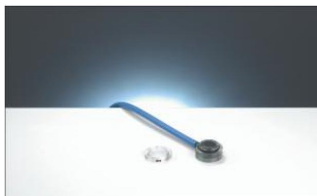
1.6 Ионизационная камера PTW-34045