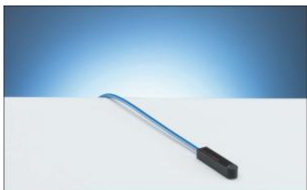
1.13 Ионизационная камера PTW-34013