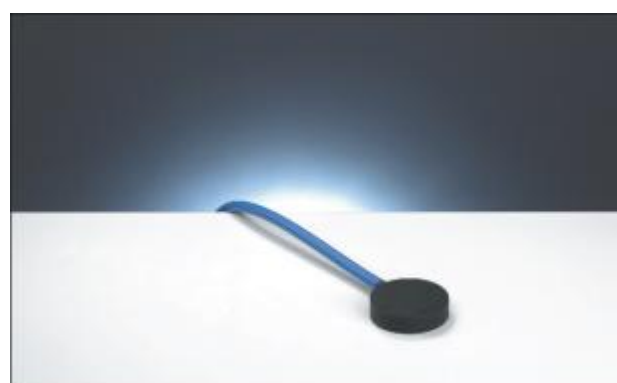
1.8 Ионизационная камера PTW-34001