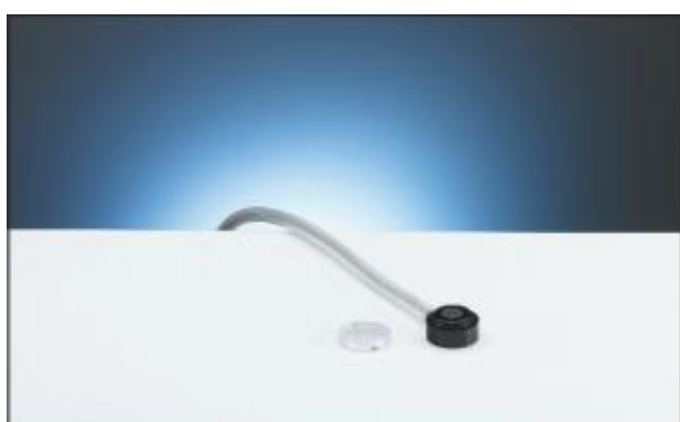
1.7 Ионизационная камера PTW-23343