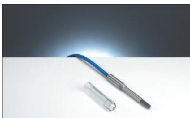
1.16 Ионизационная камера PTW-30013