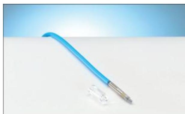
1.10 Ионизационная камера PTW-31015