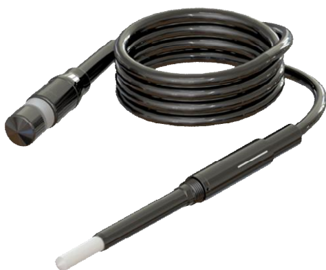
1.19 Ионизационная камера Sun Nuclear SNC600c