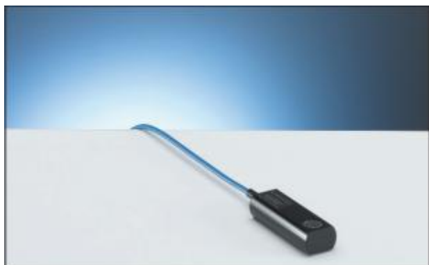
1.11 Ионизационная камера PTW-23342