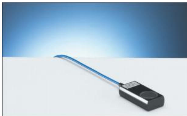
1.12 Ионизационная камера PTW-23344