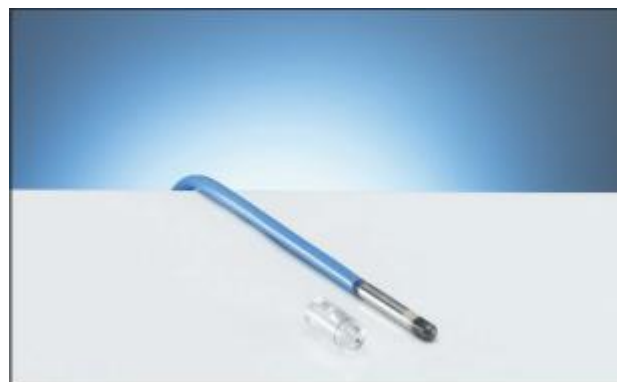
1.4 Ионизационная камера PTW-31010