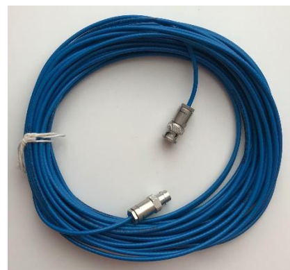
1.20 Триаксиальный кабель с антимикрофонным покрытием и триаксиальным электрометрическим разъемом, 25 м.