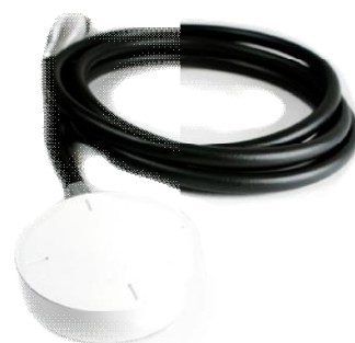
1.18 Ионизационная камера Sun Nuclear SNC350p