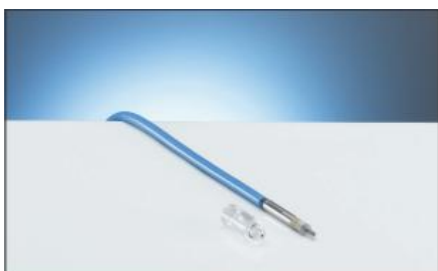
1.9 Ионизационная камера PTW-31014