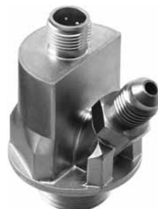
Рисунок 4- Общий вид датчиков модель DPI V.2+T