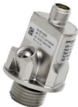
Рисунок 1 - Общий вид датчиков модель RPI+T