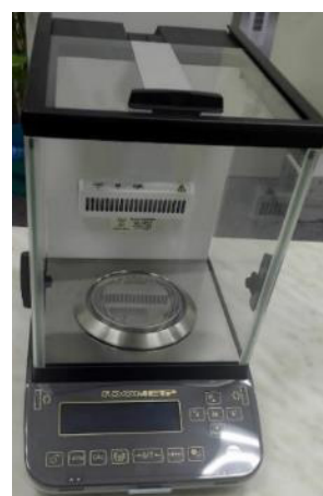
Общий вид модификаций ВЛА-220С-ОА, ВЛА-320С-ОА (исполнение с автоматизированной витриной)