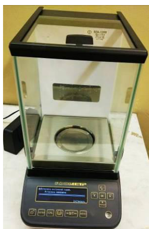
Общий вид модификации ВЛА-xxxМ