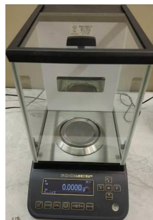
Общий вид модификаций ВЛА-xxx, ВЛА-xxxС, ВЛА-xxxС-О