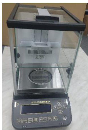
Общий вид модификации ВЛА-xxxМА (исполнение с автоматизированной витриной и регулируемым по высоте внутренним ветрозащитным экраном)