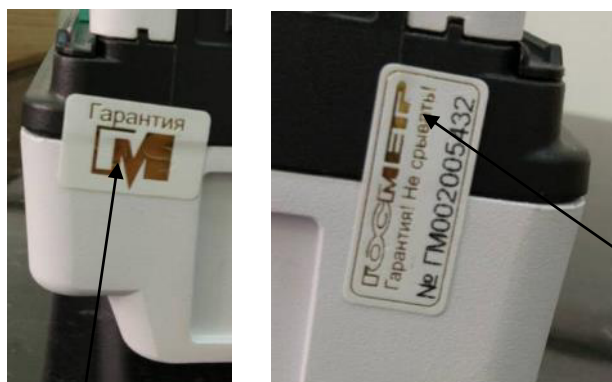
Схема пломбирования контрольными этикетками