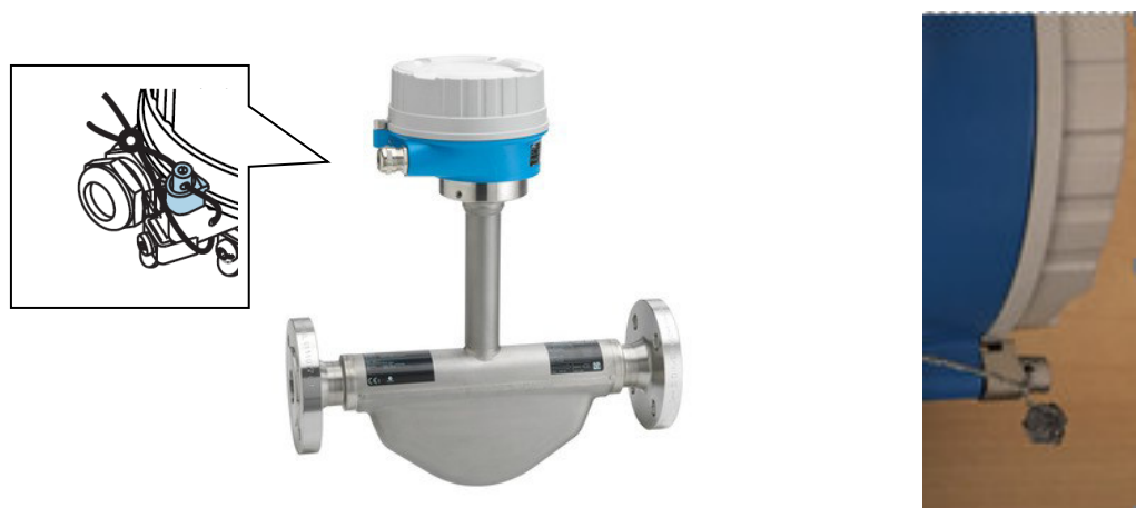
Рисунок 1 – Общий вид преобразователя расхода массового LNGmass и схема пломбирования

Для применения преобразователей в учетно-расчетных операциях конструктивно предусмотрено блокирование параметров настройки в соответствии с областью применения посредством установки DIP переключателя (переключателей) в соответствующее положение и пломбирование корпуса электронного преобразователя пломбами надзорного органа (см. Рисунки 1 и 2).