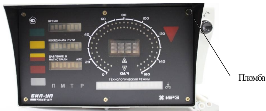
Рисунок 5 – Схема пломбировки от несанкционированного доступа блока БИЛ-УП (невстраиваемый вариант)