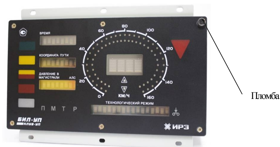
Рисунок 6 – Схема пломбировки от несанкционированного доступа блока БИЛ-УП-01 (встраиваемый вариант)