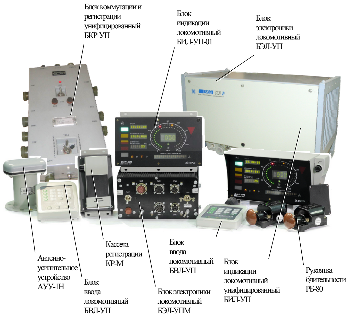
Рисунок 1 - Общий вид каналов измерительных скорости и давления из состава системы КЛУБ-УП

Общий вид каналов измерительных скорости и давления из состава системы КЛУБ-УП представлен на рисунке 1.