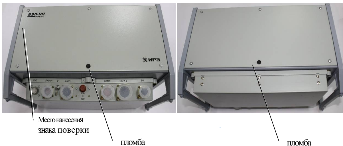
Рисунок 2 – Схема пломбировки от несанкционированного доступа блока БЭЛ-УП, обозначение места нанесения знака поверки