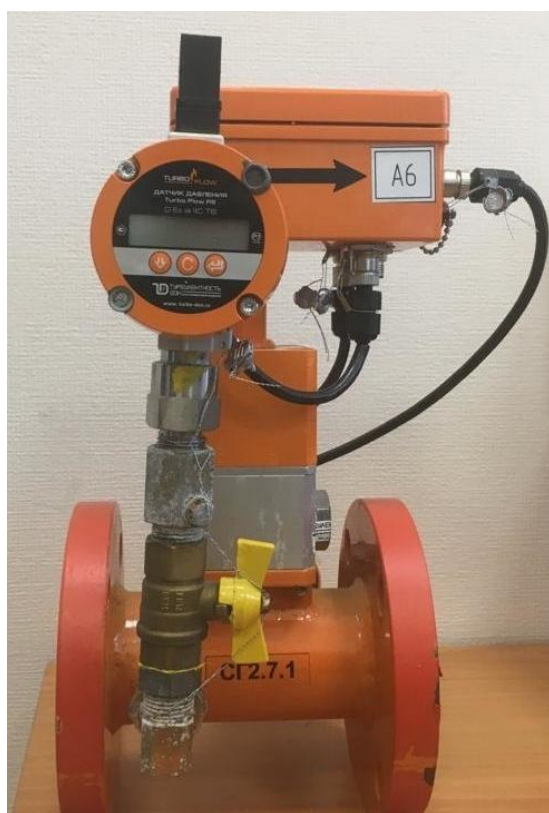
а) Расходомер Turbo Flow GFG-F