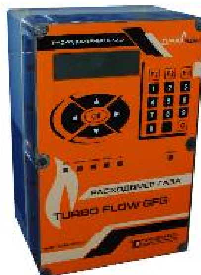
б) Внешний терминал расходомера Turbo Flow GFG-F