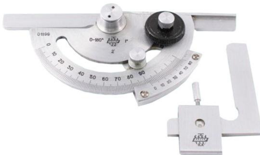
Рисунок 1 – Общий вид угломеров типа 1

Пломбирование угломеров не предусмотрено.