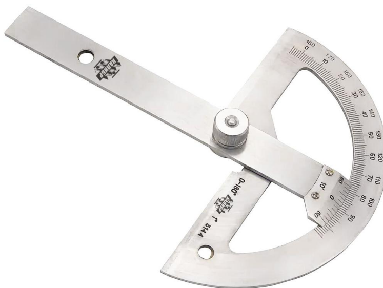
Рисунок 4 – Общий вид угломеров типа 4