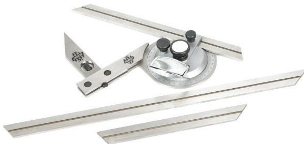
Рисунок 3 – Общий вид угломеров типа 3