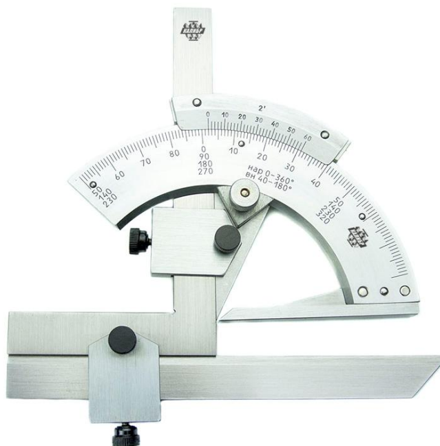
Рисунок 2 – Общий вид угломеров типа 2