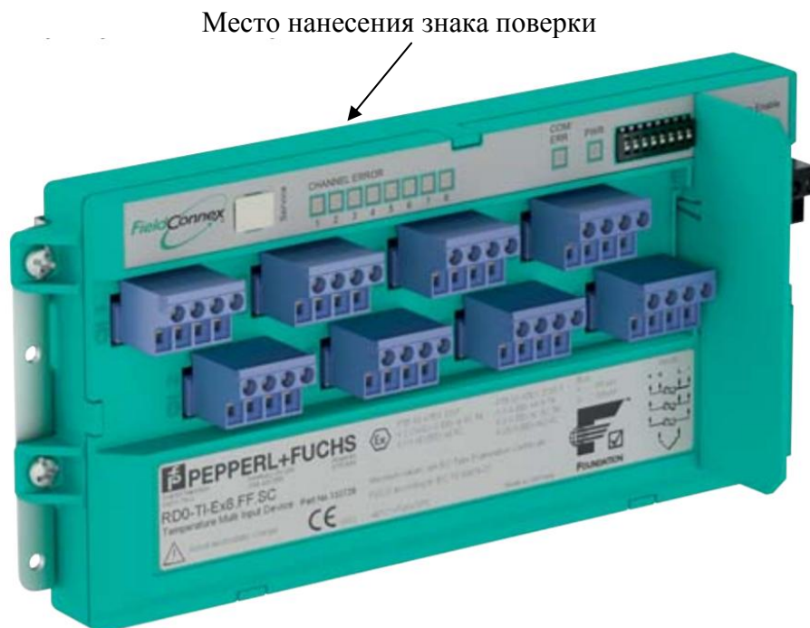
Рисунок 2 – Обозначения места нанесения знака поверки устройства