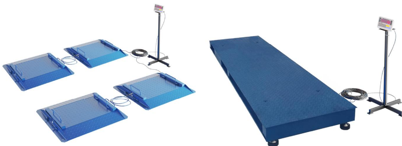
Рисунок 1 - Фотографии весов

Фотографии весов представлены на рисунке 1.