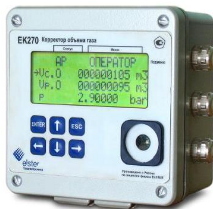
Рисунок 1 – Общий вид корректора объема газа ЕК270

Схема пломбировки от несанкционированного доступа, обозначение мест нанесения знака поверки, приведены на рисунке 2.