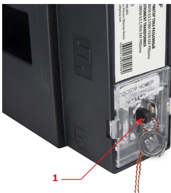
Рисунок 3 – Вид трансформаторов снизу 1 - Место навешивания пломбы с оттиском знака поверки