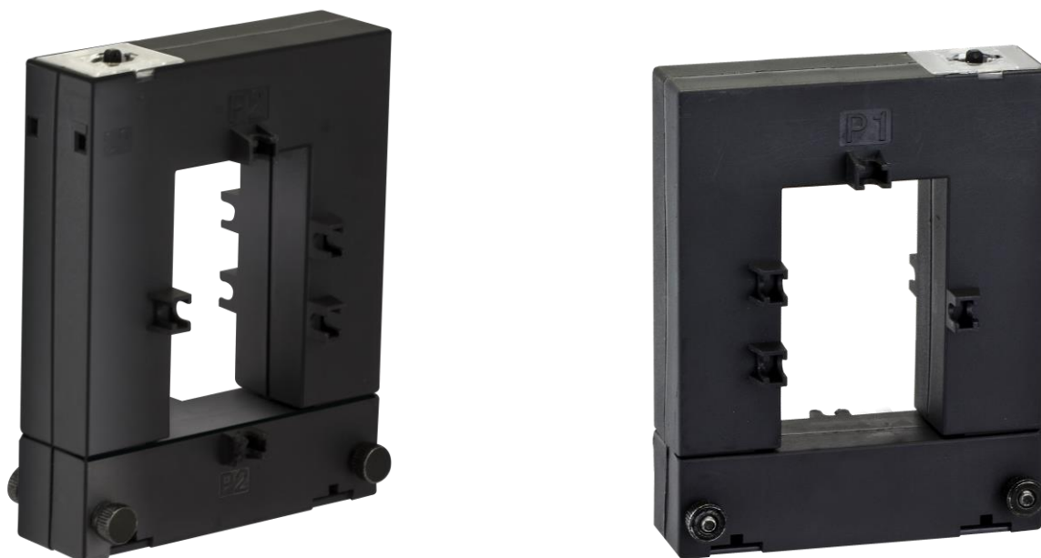
Рисунок 2 – Внешний вид трансформаторов