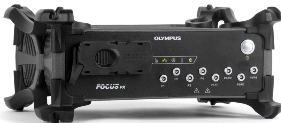
Рисунок 1 – Общий вид дефектоскопа ультразвукового FOCUS PX