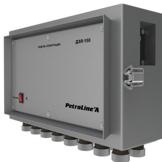
Рисунок 3 - Модуль коммутации МК-140