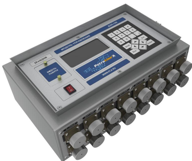
Рисунок 2 - Модуль управления МУ-150 / МУ-150(Е)