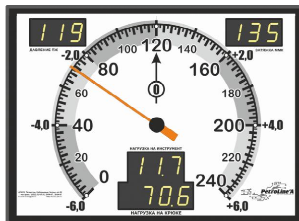
Рисунок 7 – Модуль индикации МИ-140С

Пломбирование СКПБ ДЭЛ-150 не предусмотрено.