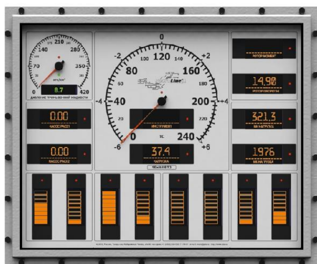
Рисунок 6 – Модуль индикации МИ-140