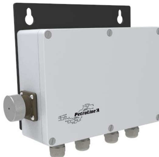
Рисунок 5 - Преобразователь сигналов ПС-150