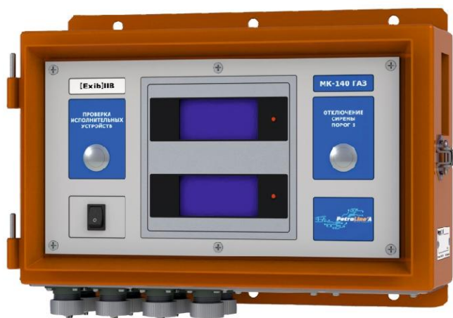
Рисунок 4 - Модуль коммутации МК-140 ГАЗ