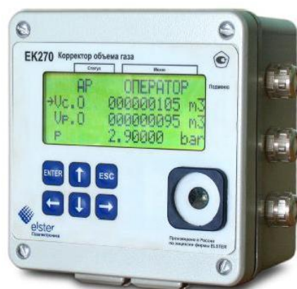
Рисунок 1 – Общий вид корректора объема газа ЕК270

Схема пломбировки от несанкционированного доступа, обозначение мест нанесения знака поверки, приведены на рисунке 2.