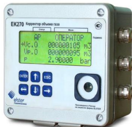
Рисунок 1 – Общий вид корректора объема газа ЕК270

Схема пломбировки от несанкционированного доступа, обозначение мест нанесения знака поверки, приведены на рисунке 2.