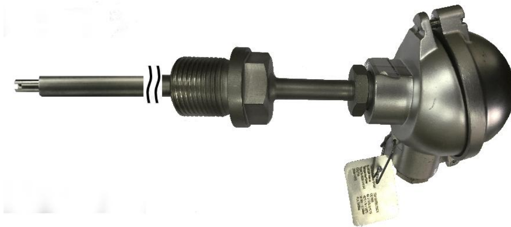
Рисунок 1 – Общий вид ТС в сборе

Общий вид ТС представлен на рисунках 1 и 2.